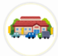
ママンマルシェ TAKANABE (宮崎県)

ポイントを利用する機会がなかったので、 ポイントを利用できてるお店が分かって嬉しい。