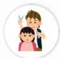
BPI目黒 (東京 都)

Vポイントをご利用いただいたお客様へ、感謝の意を込めてVポイント付与の倍率を高くするなどの工夫を行っています。