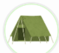
アウトドアショッ プ (兵庫県)

Vポイントを利用していただくことで、 お客様にお得にお買い物を楽しんでいただき、 少しでも自店の購入点数を増やしてもらいたいため。