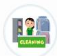
黒川クリーニング (福島県)

お客様にはVポイントをご利用いただきお得感を感じていただくために、黒川クリーニング社 全店でご利用促進に取り組んでおります。