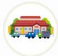
ママンマルシェ TAKANABE (宮崎県)

Vポイントカードの提示をご案内することで、 お客様へのVポイント利用の機会を増やしています。