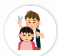
BPI Jijū (東京都)

Vポイントをお店で利用できること、使い方を知らない方がまだまだいらっしゃいます。 しっかり店頭での告知を行うことが大切です。