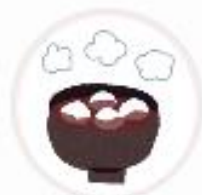
都松庵枚方T-SITE (大阪府)

お客様へ「保有ポイント数」をお伝えすることです。 Vポイント残高を確認し、お客様への声がけを地道に行うことが大事です。