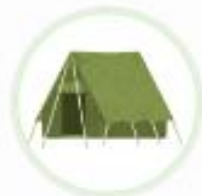
アウトドアショップ (福岡県)

Vポイントをご利用いただいたお客様へ、感謝の意を込めてVポイント付与の倍率を高くするなどの工夫を行っています。