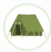
アウトドアショップ ア (兵庫県)

自店の利用者分析レポート (Vポイントレポート) を確認すること で、商圈や客層、販促効果の調査や確認が行えるため。